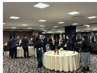
※昨年度の北海道地区懇親会の様子

日時：令和8年9月15日（火）18:30～20:30 場所：TKP ガーデンシティ PREMIUM 品川 HEART （東京都 港区港南 1-8-23 Shinagawa HEART 8階）