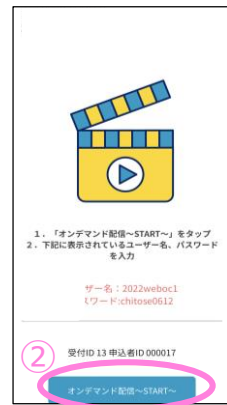
スワイプ後の画面