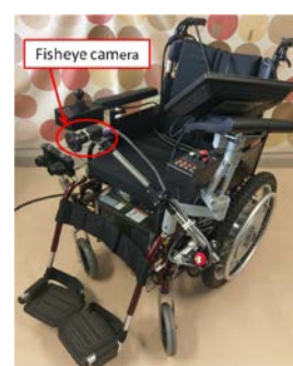
Fig. 1. Wheelchair Robot

今後の課題として、移動物体への対応が挙げられる。現状の提案手法においても一定の対応は可能と考えられるが、今後の詳細な検討が必要である。