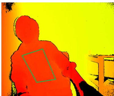
図 1 関心領域の追跡

参考文献 : [1] Hirooki Aoki, et al.: "Basic Study on Non-contact Respiration Measurement during Exercise Tolerance Test by Using Kinect Sensor", Proceedings of 2015 IEEE/SICE International Symposium on System Integration, pp. 217-222 (2015)